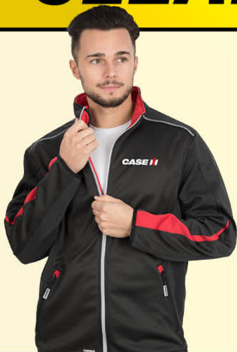
Vortex Jacket Blouson Vortex