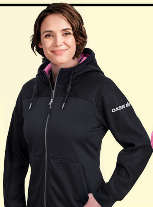
Trail Hybrid Jacket Blouson Hybride Trail

IH01-4195 Ladies/Femmes | S-L, 2XL | P-G, 2TG