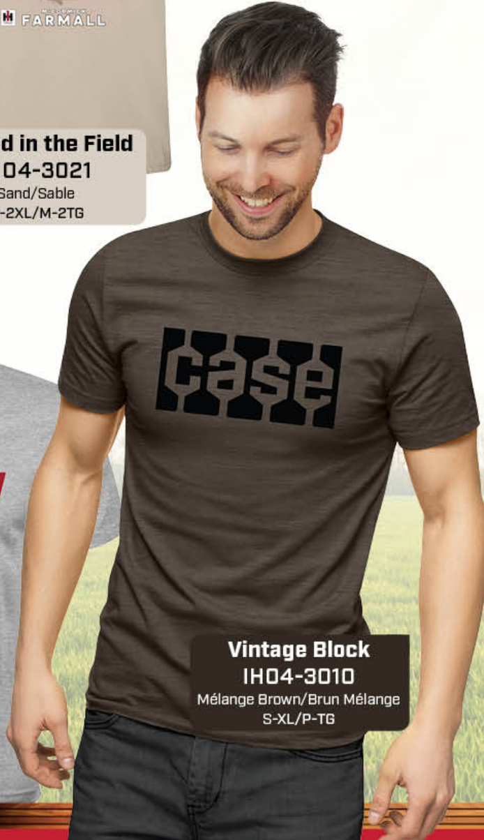
Vintage Block IH04-3010 Mélange Brown/Brun Mélange S-XL/P-TG