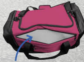
Waterproof Compartment Compartiment étanche

23" L x 12" W x 13" H | 23po L x 12po P x 13po H