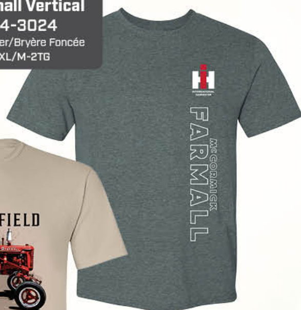
IH Farmall Vertical IH04-3024 Dark Heather/Bryère Foncée M-2XL/M-2TG