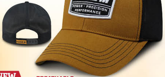
NEW NOUVEAU BREATHABLE RESPIRANT WorkShop Patch Snap Cap IH07-2814 | Tough Tan/Black | Tan/Noir