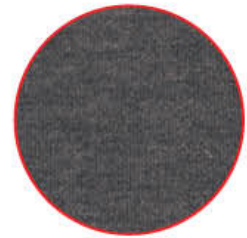
Fabric detail Détails du tissu

IH02-4644 Men's/Hommes Charcoal | Anthracite | S-3XL | P-3TG