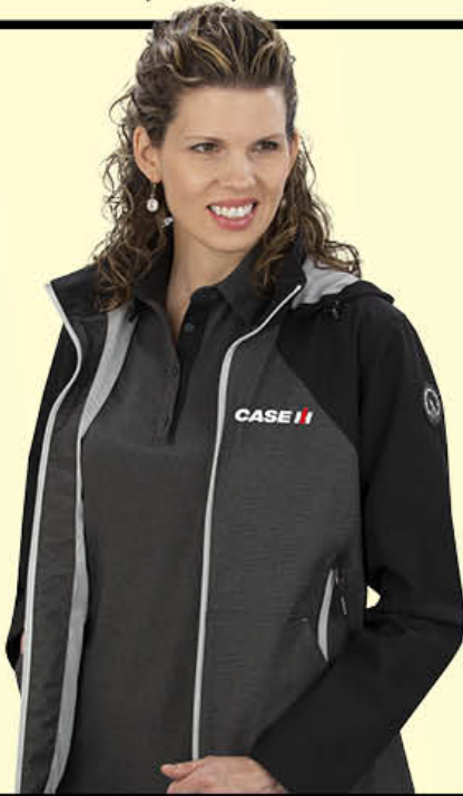
Rev'd Up Jacket Blouson Rev'd Up