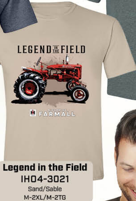
Legend in the Field IH04-3021 Sand/Sable M-2XL/M-2TG