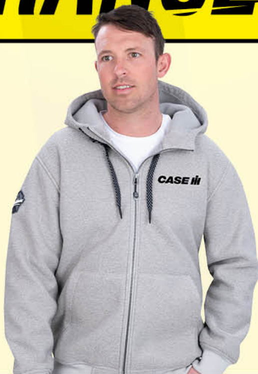
Trail Country Jackets