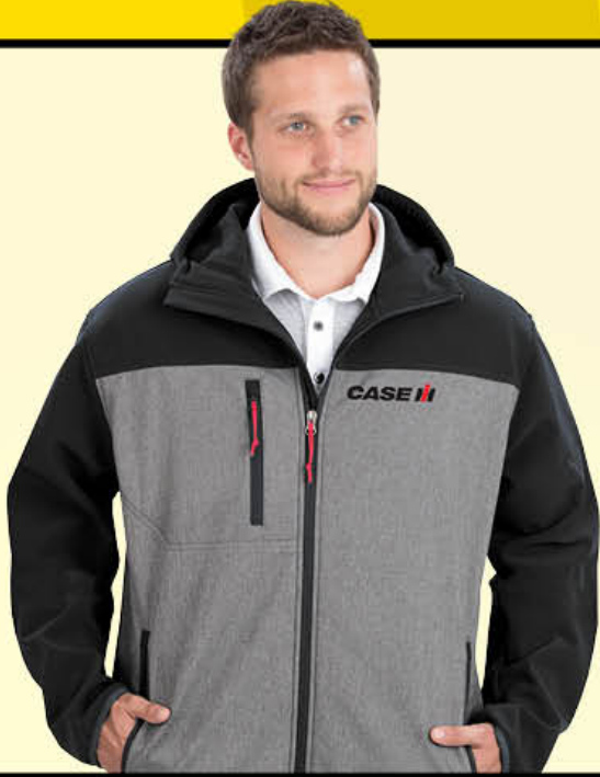
High Frequency Jacket Blouson High Frequency