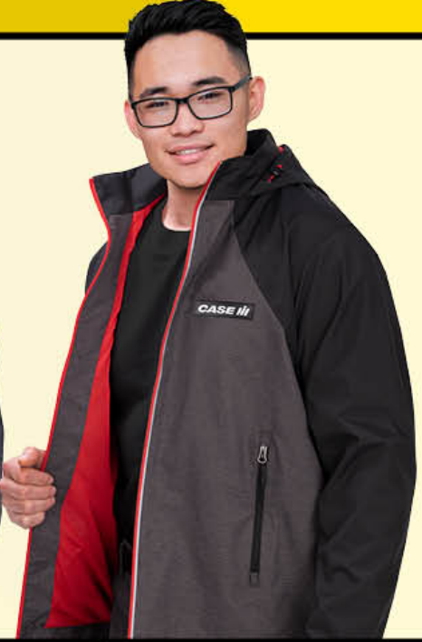
High Speed Jacket Blouson High Speed