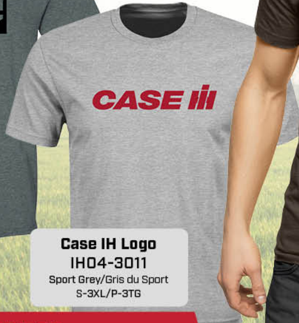
Case IH Logo IH04-3011 Sport Grey/Gris du Sport S-3XL/P-3TG