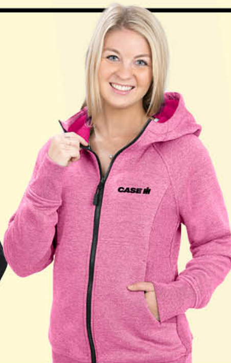
Shifter Fleece Molleton Shifter