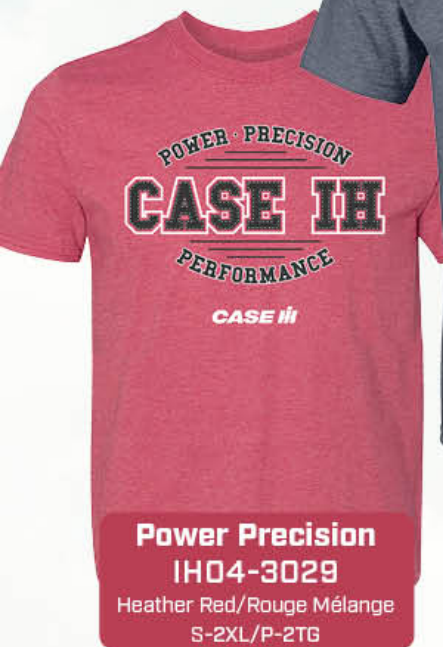
Power Precision IH04-3029 Heather Red/Rouge Mélange S-2XL/P-2TG