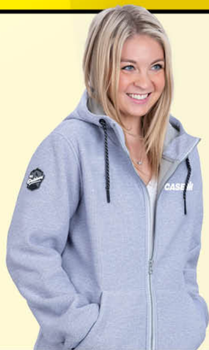
Blousons Trail Country

IH01-4195 Ladies/Femmes | S-L, 2XL | P-G, 2TG