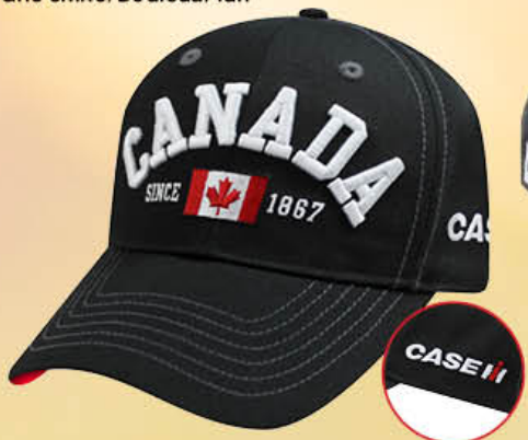
Canada 1867 Cap IH07-2792 | Black | Noir