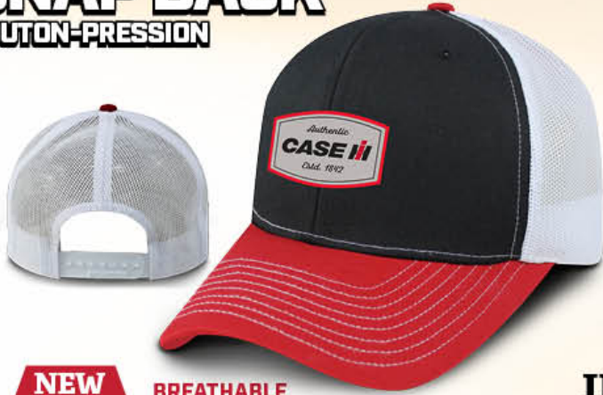
NEW NOUVEAU BREATHABLE RESPIRANT Vintage Snap Cap IH07-2810 Red/Black/White | Rouge/Noir/Blanc