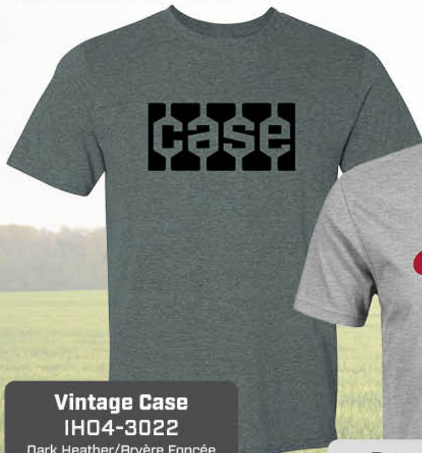
Vintage Case IH04-3022 Dark Heather/Bryère Foncée S-2XL/P-2TG