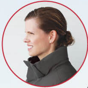
Removable Hood Capuche amovible