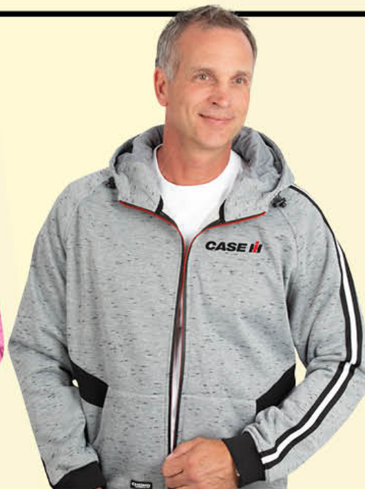
Voltage Fleece Molleton Voltage