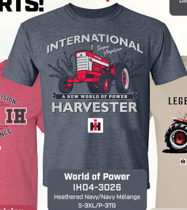
World of Power IH04-3026 Heathered Navy/Navy Mélange S-3XL/P-3TG