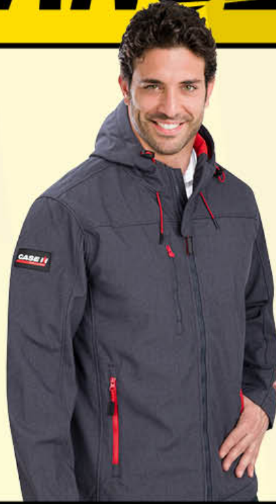
Endurance Jacket Blouson Endurance