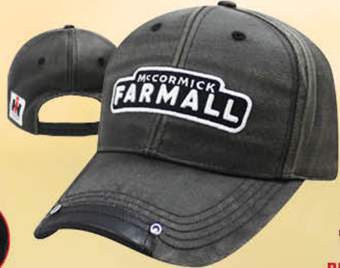
Vintage Workwear Cap IH07-2757 Iron Brown/Silver | Brun le fer/Argent