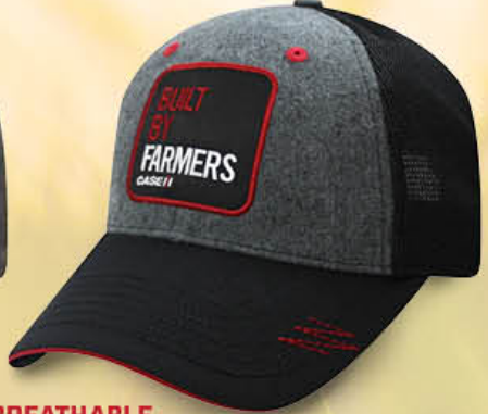
BREATHABLE RESPIRANT Built By Farmers Mesh Cap IH07-2766 Charcoal/Black/Red | Anthracite/Noir/Rouge