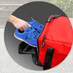
Shoe Pocket Poche à chaussures