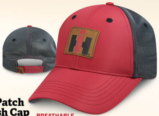
IH Patch Mesh Cap IH07-2805 Burgundy/Charcoal/Tan Bourgogne/Anthracite/Tanné BREATHABLE RESPIRANT